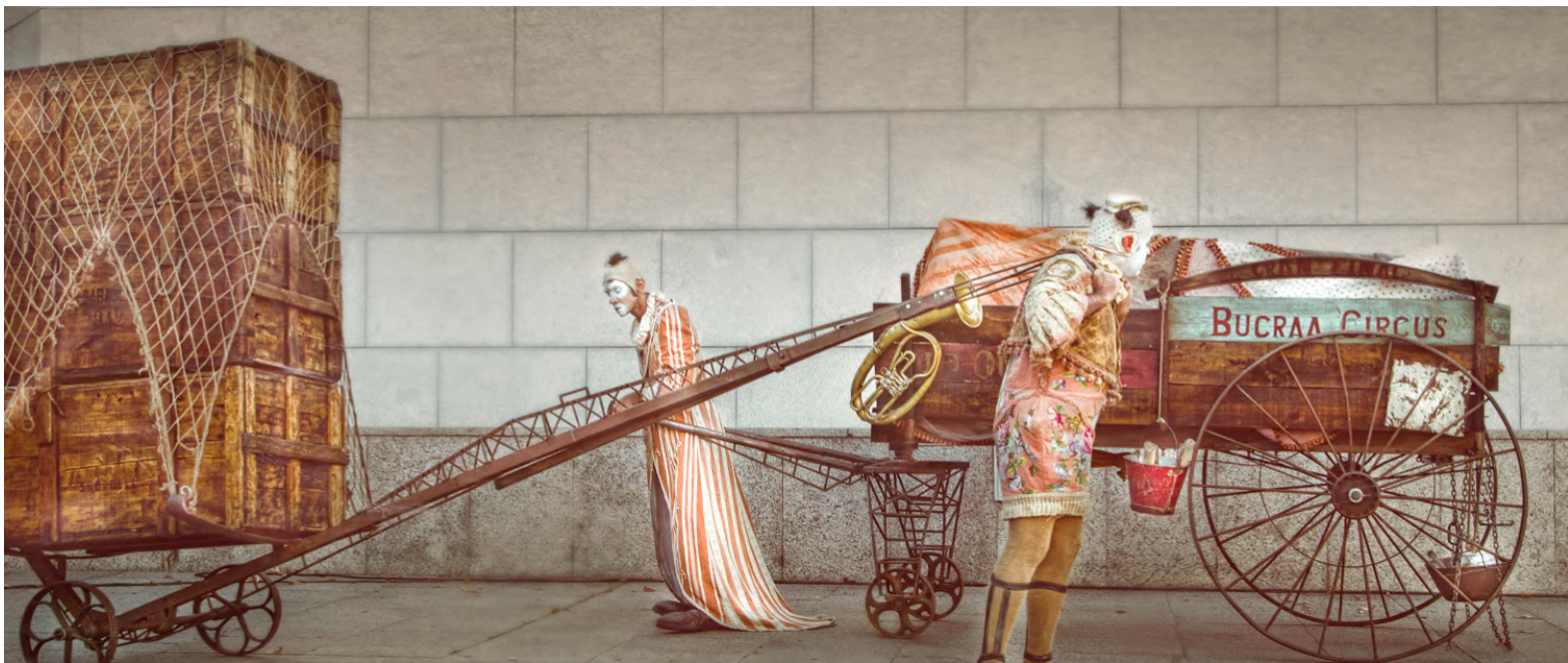
Espectáculo estrenado en el festival de payasos de Cornellá 2018

Un espectáculo de Clown Y Teatro gestual que nos sumerge en un mundo pasado y particular, por su estética y su belleza poética , y nos atrapa con la capacidad de juego e improvisación de sus personajes, una historia de amor y guerra coronada por un " Gran Final " que no se puede desvelar, y que es preciso ser vivido!